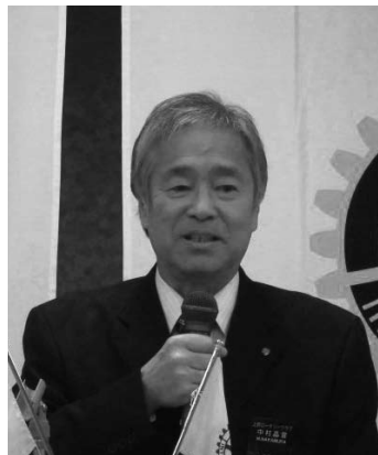
▲会長 年頭挨拶 (1/6)