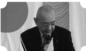
▲クラブアッセンブリー (1/27)