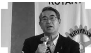
▲クラブアッセンブリー (1/20)