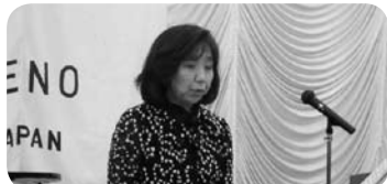
左橋・桂両先生による演奏会