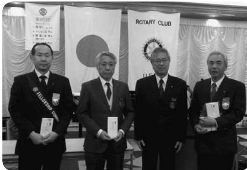
▲連続・累積出席表彰