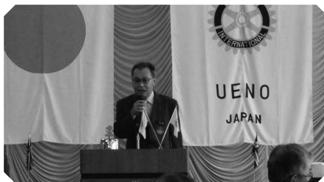
▲鉄崎会長年頭挨拶（7/1）