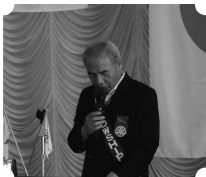
▲クラブアッセンブリー（7/14）