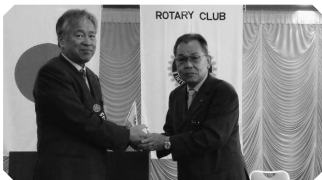
▲会長バッチの交換（7/1）