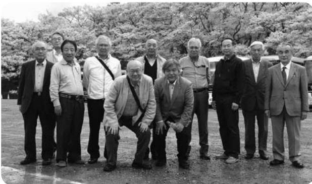
▲春の親睦家族会 (4/18・19)