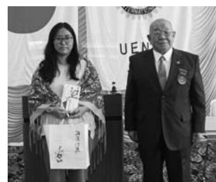
▲ウクライナへ支援金の贈呈 (5/17)