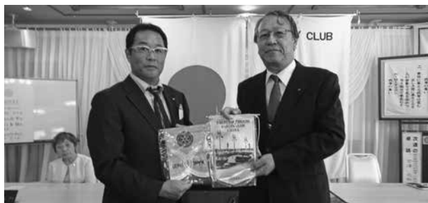
▲八千代中央RC幹事とバナー交換 (10/10)