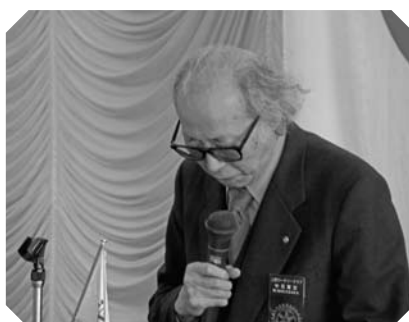
▲ロータリーの友 読みどころ 中坂君 (3/6)