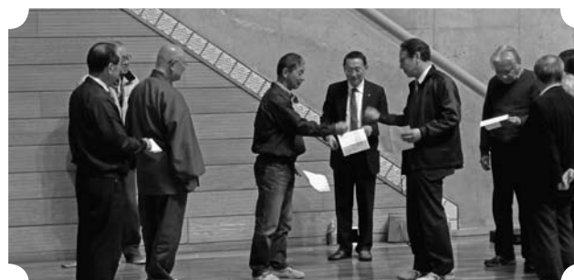
▲移動例会 (ボッチャ研修会) (3/27)