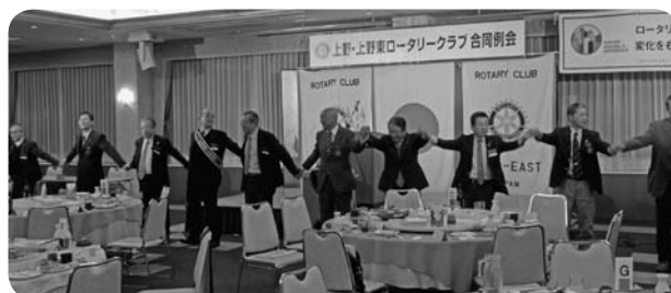
上野・上野東合同例会 (3/20)